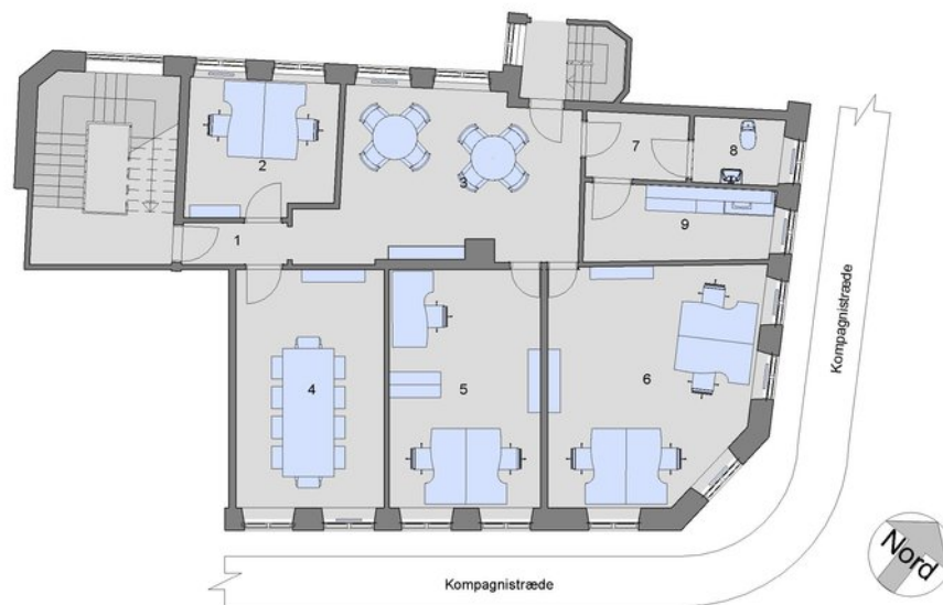
Kompagnistræde 20A, 1.tv